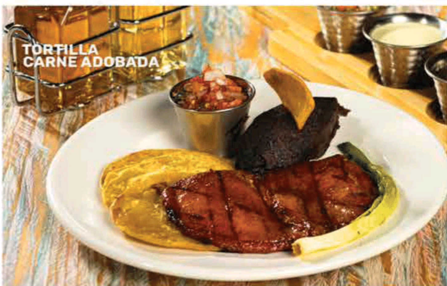
TORTILLA CARNE ADOBADA