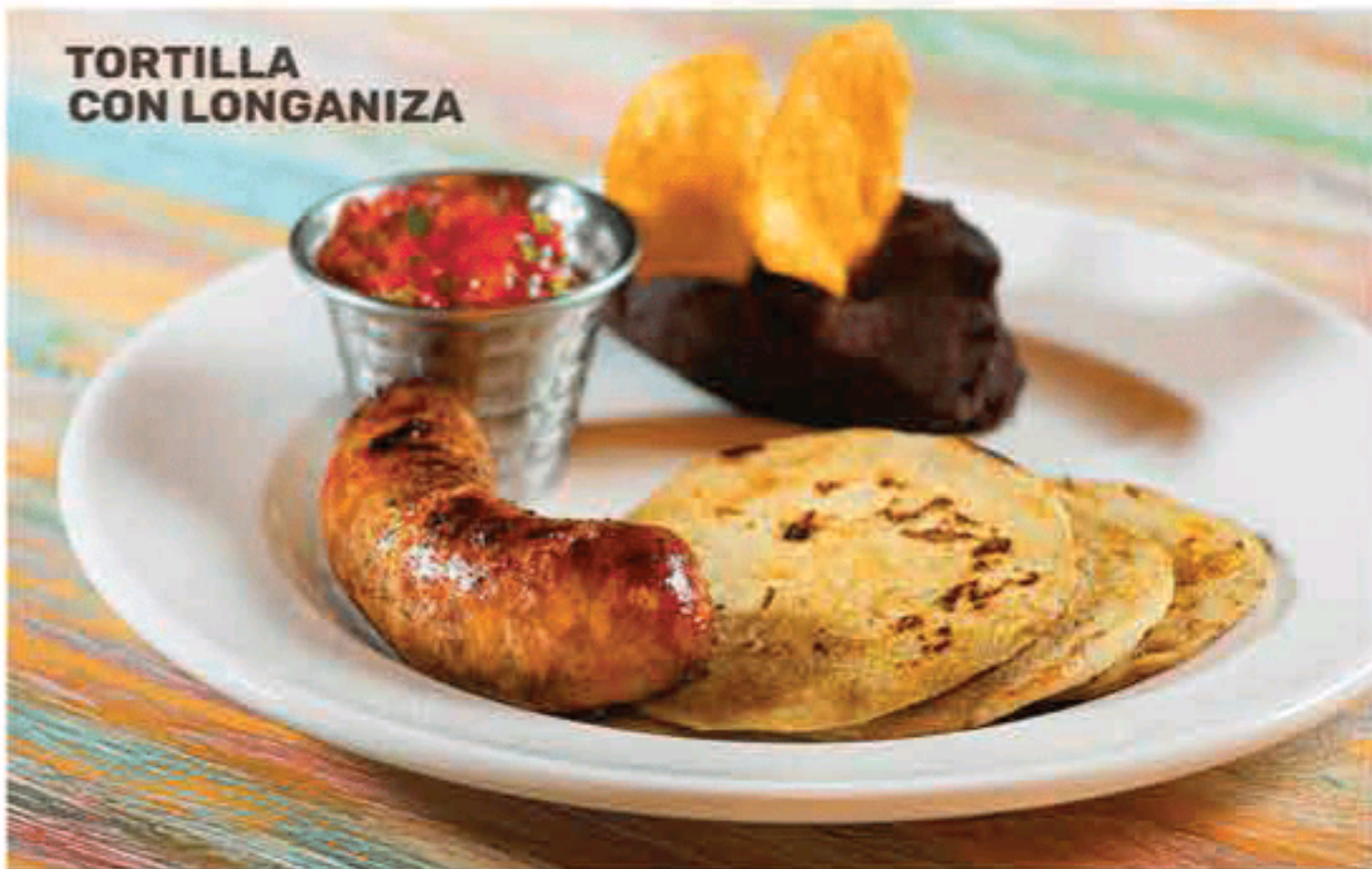
TORTILLA CON LONGANIZA